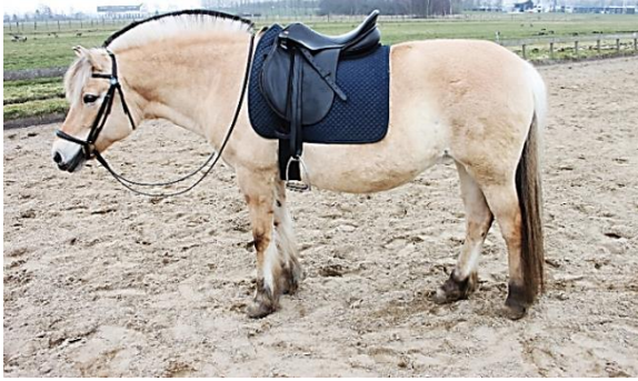
Een correct opgezadeld paard.

Om op te zadelen leg je eerst het zadel over je linkerarm en loop je naar de linkerkant van het paard. Je tilt dan het zadel over de rug heen en legt het zo neer dat het zadel iets op de schoft ligt. Leg uiteraard wel zachtjes het zadel neer zodat je paard niet schrikt. Als het zadel ligt dan trek je het een beetje naar achteren zodat de haren onder het